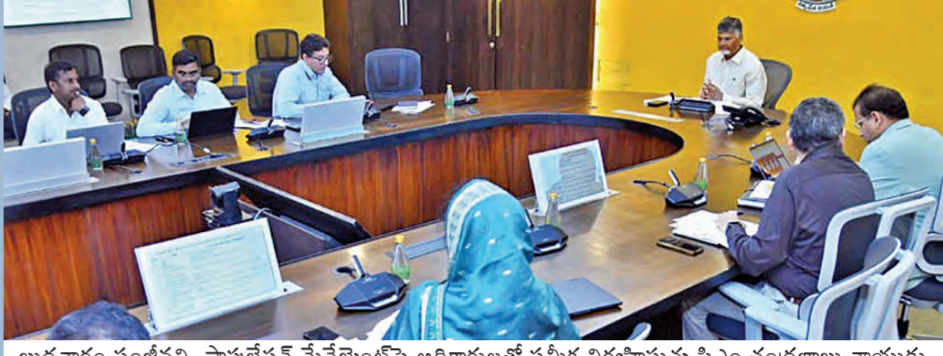
బుధవారం సంచీవని, పాపులేషన్ మేనేజ్మెంట్ పై అధికారులతో సమీక్ష నిర్వహిస్తున్న సీఎం చంద్రబాబు నాయుడు

మొదటిదశలో 4, తర్వాత 6 కాలేజీల నిర్మాణం త్వరలో స్టేట్ హెల్త్ ఇన్వెస్ట్ మెంట్ విధానం శరవేగంగా సంజీవని ప్రాజెక్టు విస్తరణ అమరావతిలో నేచురోపతి సంస్థ కోసం కేంద్రానికి లేఖ: సీఎం చంద్రబాబు