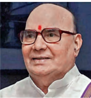
నాదెండ్ల భాస్కరరావు (పైట)

ఉమ్మడి ఎపి మాజీ సీఎం నాదెండ్ల కన్నమూత కొద్ది రోజులుగా ఆస్పత్రిలో చికిత్స 1980 దశకంలో టిడిపి, కాంగ్రెస్ లో నాదెండ్ల కీలకపాత్ర 1984లో నెలరోజులు సీఎం బాధ్యతలు సీఎం చంద్రబాబు, డి.సీఎం పవన్, మరికొందరు ప్రముఖుల ప్రగాఢ సంతాపం నేడు హైదరాబాద్ లో అంత్యక్రియలు విజయవాడ, ఏప్రిల్ 22 ప్రభాతవార్త ప్రతినిధి: సీనియర్ రాజకీయవేత్త, ఉమ్మడి ఆంధ్రప్రదేశ్ మాజీ ముఖ్యమంత్రి, ఖమ్మం మాజీ ఎపి నాదెండ్ల భాస్కరరావు హైదరాబాద్ ఆసుపత్రిలో కన్ను మూశారు. కొంత కాలం నుంచి భాస్కరరావు ఆనారోగ్యంతో బాధపడుతున్నారు. నాదెండ్ల భాస్కర రావు 1935 జూన్ 23లో గుంటూరులో జన్మించారు. ఉమ్మడి ఆంధ్రప్రదేశ్ చరిత్రలో అతి తక్కువ కాలం 1984 ఆగస్టు 16 నుంచి సెప్టెంబరు 16 వరకు 31 రోజులు ముఖ్యమంత్రిగా >>2