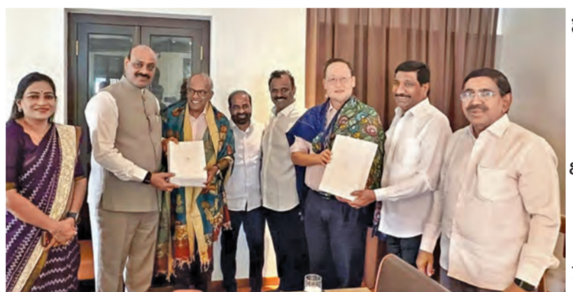
సింగపూర్ ప్రతినిధులతో రాష్ట్రమంతటా బృందం ఖేటీ దృశ్యం